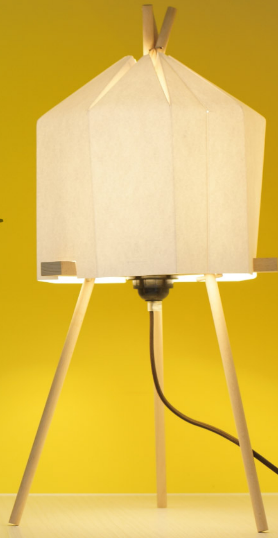
Paper lamp by 利志榮